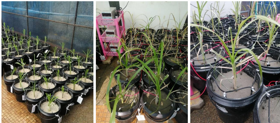
รูปที่ 2 การทดลองการกำจัดสารหนูในกากโลหกรรมด้วยหญ้าเนเปียร์แคระร่วมกับจลนศาสตร์ไฟฟ้า

แม้ว่าการเพิ่มประสิทธิภาพการบำบัดโลหะหนักด้วยพืชด้วยการให้ไฟฟ้ากระแสตรง จะทำให้เกิดผลกระทบต่อมวลชีวภาพของพืช จากการเปลี่ยนแปลงค่าความเป็นกรด-ด่าง หากแต่การเคลื่อนที่ของโลหะหนักจากการให้ไฟฟ้ากระแสตรง จะมีทิศทางที่แน่นอน ต่างจากการให้ไฟฟ้ากระแสสลับที่ทำให้โลหะหนักเกิดการเคลื่อนที่ในทิศทางที่สลับไปมาตามความถี่ของกระแสไฟฟ้า จึงทำให้โลหะหนักมีโอกาสที่จะเกิดการเคลื่อนที่ไปนอกบริเวณรากพืช และเกิดการปนเปื้อนออกสู่สิ่งแวดล้อมได้ ดังนั้น การให้ไฟฟ้ากระแสตรงที่มีขนาดสนามไฟฟ้าที่เหมาะสมต่อพืชแต่ละชนิด จึงมีความสำคัญอย่างยิ่งในการเพิ่มประสิทธิภาพในการบำบัดโลหะหนักด้วยพืชควบคู่ไปกับการเพิ่มชีวมวลของพืชพลังงาน